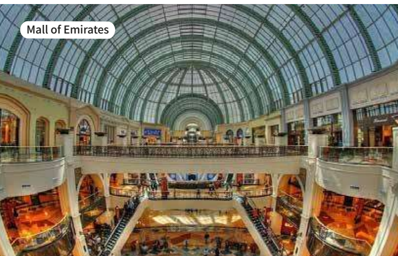
Mall of Emirates