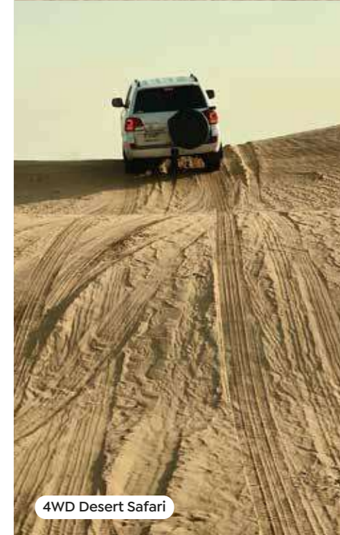
4WD Desert Safari