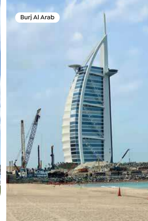
Burj Al Arab