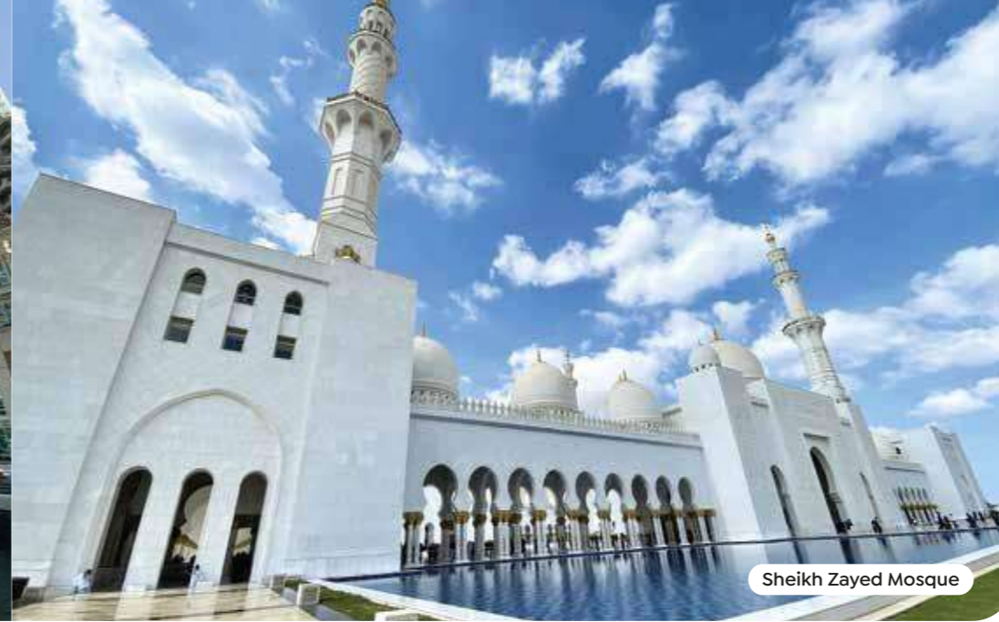
Sheikh Zayed Mosque