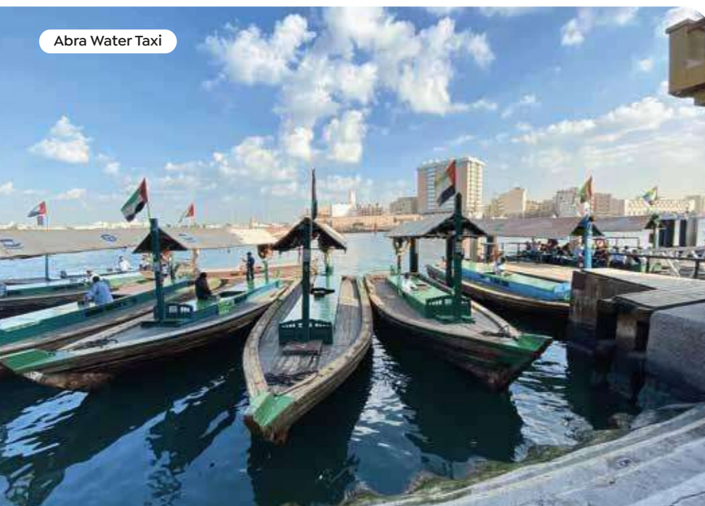
Abra Water Taxi